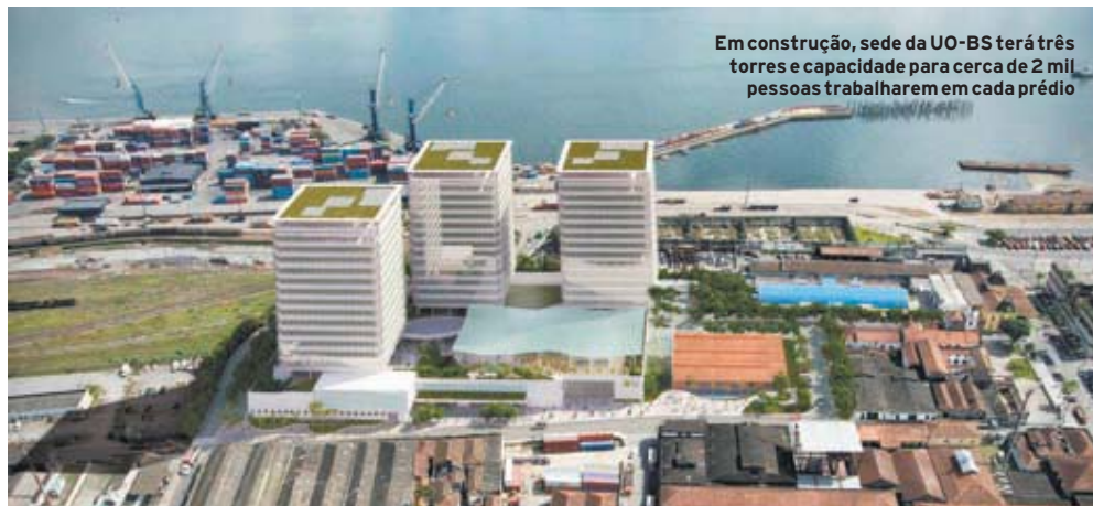
Em construção, sede da UO-BS terá três torres e capacidade para cerca de 2 mil pessoas trabalharem em cada prédio

A agência de classificação de riscos Austin Rating confirmou recentemente a nota AA, atribuída em dezembro a Santos. A agência criou em 2006 uma metodologia para avaliar cidades baseada em dois principais conceitos: fatores qualitativos, como indicadores econômicos, sociais e políticos; e fatores quantitativos, baseados nas contas fiscais. Segundo a agência, Santos que detém o 5º melhor índice de desenvolvimento humano (IDH) do país, e o 3º do estado de São Paulo, conta, a longo prazo, com diversos fatores positivos que sustentam a nota atribuída, como, por exemplo, o cumprimento da Lei de Responsabilidade Fiscal; forte incremento da receita; baixo nível de endividamento; e, finalmente, os investimentos previstos pela Petrobras para a cidade. M.H.N.